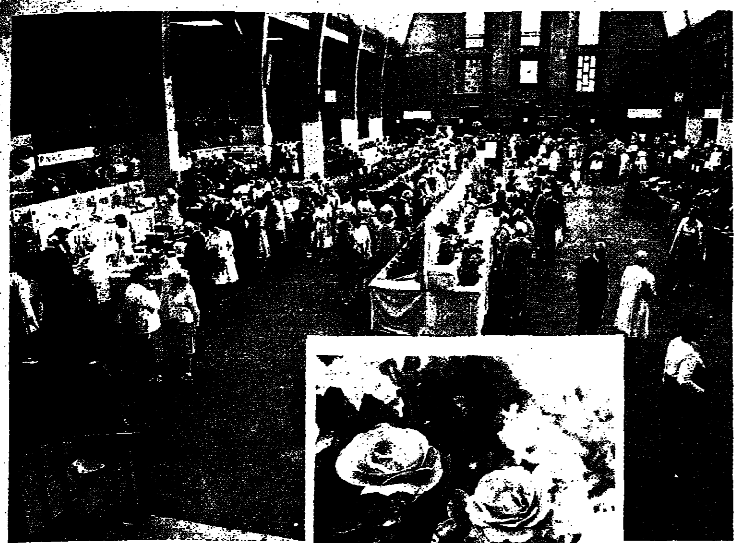
كل الوان الجميلة كانت هناك

ومن الاسس التي تحرص عليها التربية الحديثة وبنيت اصولها في الحديث التدي عليه الصلاة والسلام قضية المسئول الطبيعية بين الطلبة دون اعتبار للتفوق الطبيعية ، فما قاله الرسول عليه السلام : « اباؤكم ووالداهم سببه من عندهم » وتعليمهم بالتاريخ مثل كتاب المعارف لابن قتيبة حيث يذكر أسماء عدد من التلمذ اشتغلوا بالتعليم في القرن الاول للهجرة وكتبه العواصم من التواضع لابن عربي الختوي ٥٢٤ هـ ومقدمة ابن خلدون الحضرمي .